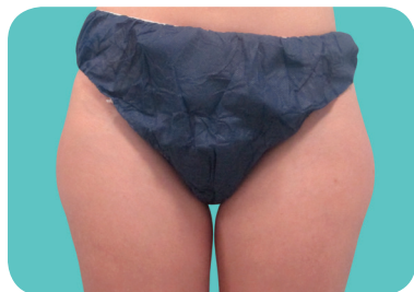
Résultat traitement culotte de cheval

IMPORTANT : pour plus d'information sur les contre-indications, consultez votre médecin.