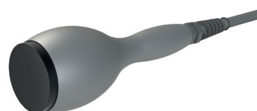
Pièce à main optionnelle.

Pièce à main à ultrasons plat : agissant sur l'adipocyte en favorisant la réduction du tissu adipeux. Convient pour les petites zones.